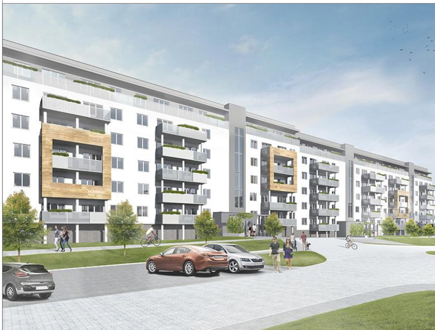
BUDYNEK NR 14

WYMIARY PODANO W ŚWIETLE ŚCIAN SUROWYCH. NINIEJSZE DANE SĄ POGŁĄDOWE I MOGĄ ODBIEGAĆ OD OSTATECZNEGO PROJEKTU REALIZACYJNEGO.